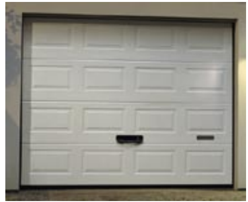
Crawford g60 Classic

Crawford g60 Classic kan motordrivas med någon av Crawford's portautomatiker: Crawford Ultra, Crawford Ultra Excellent eller Crawford Ultra S.