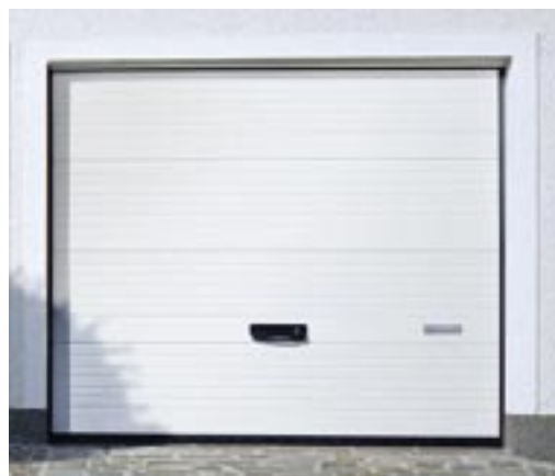
Crawford g60 Line

Crawford g60 Line kan motordrivas med någon av Crawford's portautomatiker: Crawford Ultra, Crawford Ultra Excellent eller Crawford Ultra S.