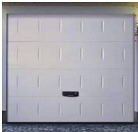
Crawford g60 Ellips

Crawford g60 Ellips kan motordrivas med någon av Crawfords portautomatiker: Crawford Ultra, Crawford Ultra Excellent eller Crawford Ultra S.