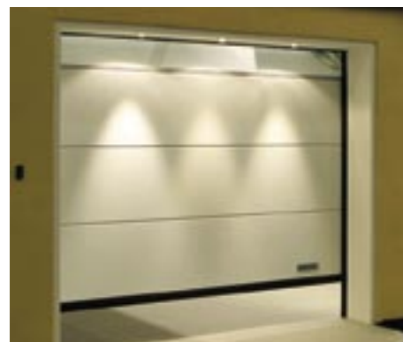
Crawford g60 Style

Crawford g60 Style kan motordrivas med någon av Crawfords portautomatiker: Crawford Ultra, Crawford Ultra Excellent eller Crawford Ultra S.